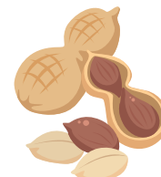
落花生 (ピーナッツ)